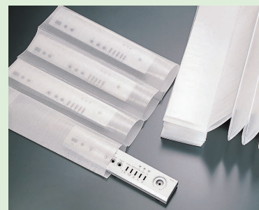
使用例(家電部品の包装)